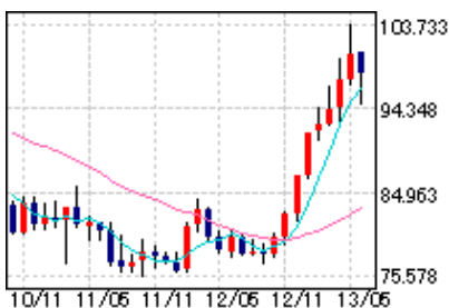
ドル円相場チャート「Yahoo!ファイナンス」より

つぎに、ドル円相場を見てみましょう。ここ1年の間に急激に円安に向かってるのがわかりますね。国内で金の価格が高騰しているのは、このような理由もあるのです。